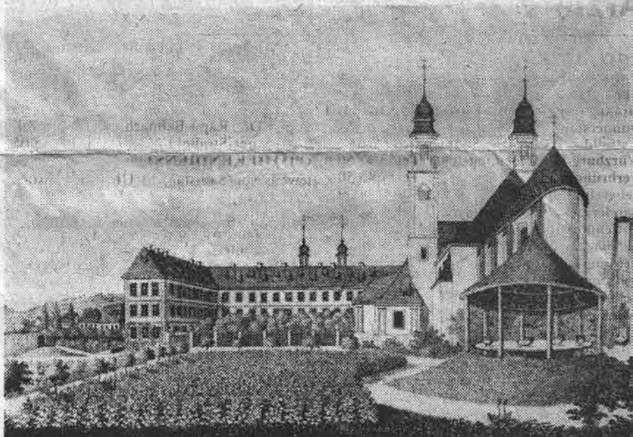
Eine Rarität: ein Stich um 1830. Im ehemaligen Kloster - später Sitz der Regierung von Unterfranken - war vorübergehend das orthopädische Caroline-Institut untergebracht.